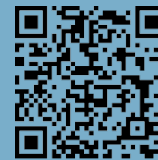
9 Rathaus/Town Hall