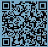
1 Kunstgrenze/ Art Border