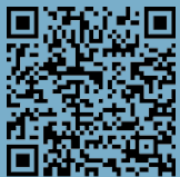
5 Kaiserbrunnen/ Emperors Fountain