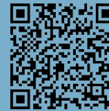
7 Stadtkirche/ Town Church