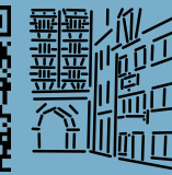
8 Hus-Haus & Schnetztor