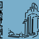
10 Lenk-Brunnen/ Lenk Fountain